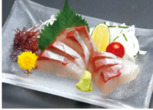
かんぱち 1,300円 (税込 1,430円)