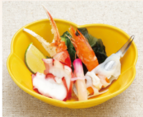
酢の物盛合せ 500円 (税込 550円)