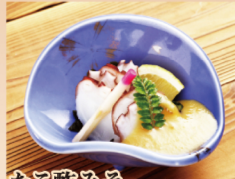
たこ酢みそ 650円 (税込 715円)