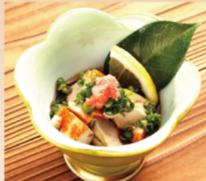
あんきもポン酢 600円 (税込 660円)