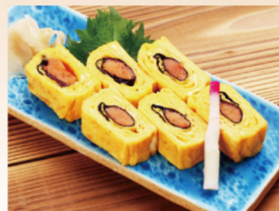
明太子たまご焼き 600円 (税込 660円)