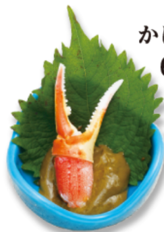
かにみそ 600円 (税込 660円)