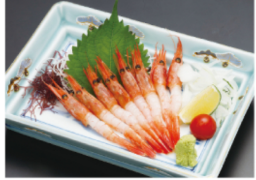
甘海老 1,000円 (税込 1,100円)