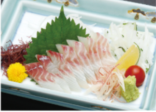
鯛 1,200円 (税込 1,320円)