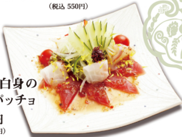
まぐろと白身の カルパッチョ 700円 (税込 770円)