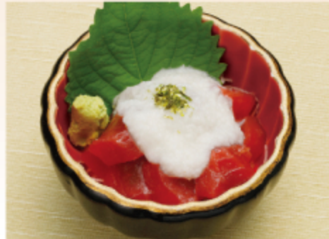
まぐろ山掛け 500円 (税込 550円)