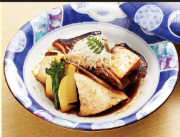
あら煮 800円 (税込 880円)