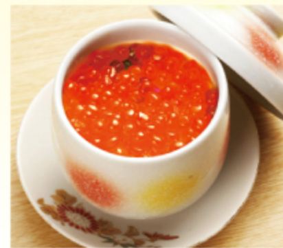
いくら 茶碗蒸し 650円 (税込 715円)