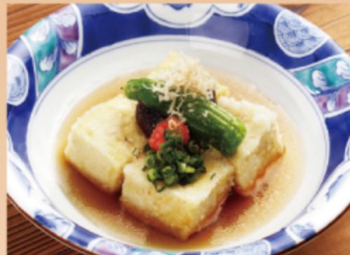
揚げ出し豆腐 380円 (税込 418円)