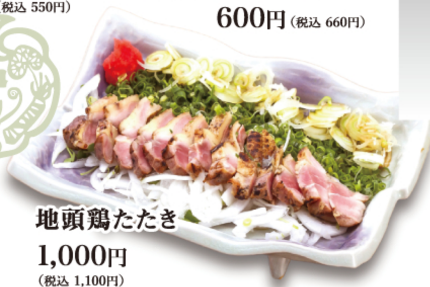
地頭鶏たたき 1,000円 (税込 1,100円)