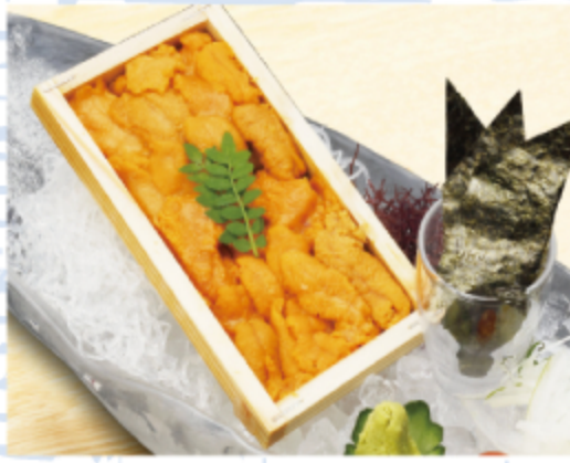
生うに 2,500円 (税込 2,750円)