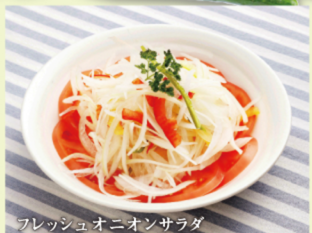
フレッシュオニオンサラダ