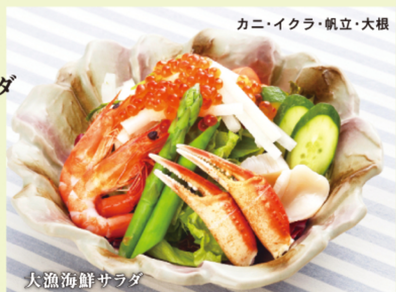
カニ・イクラ・帆立・大根