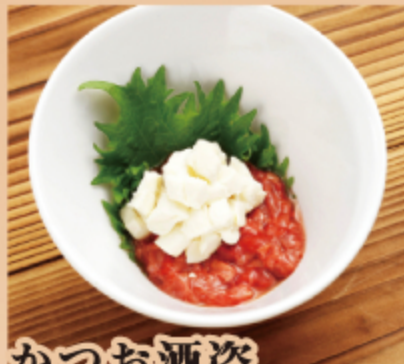
かつお酒盗 クリームチーズ 380円 (税込 418円)