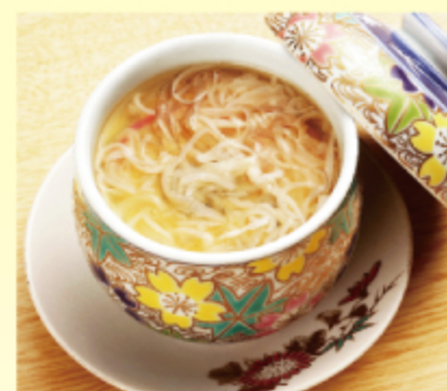
フカヒレ入り茶碗蒸し 500円 (税込 550円)