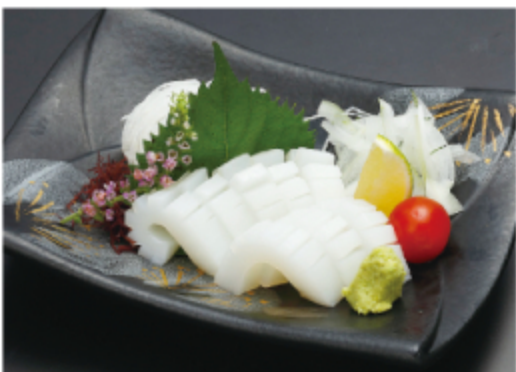
イカ(甲イカ) 700円(税込 770円)