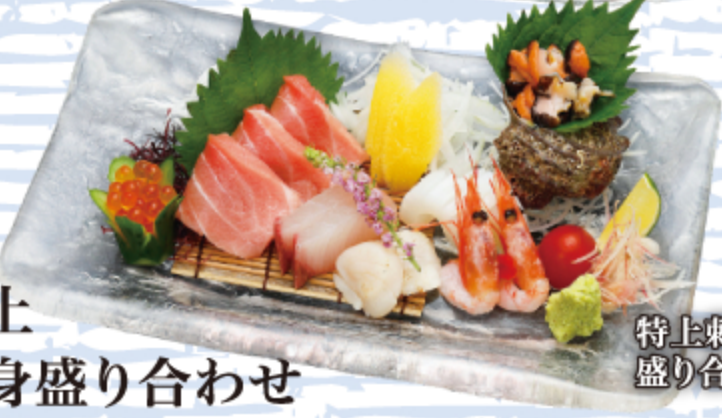
特上刺身 盛り合わせ