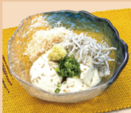
日向灘しらす豆腐 380円 (税込 418円)