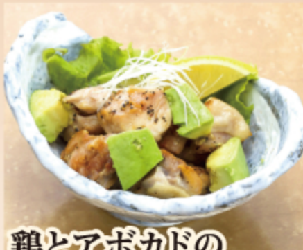
鶏とアボカドの わさび醤油 550円 (税込 605円)