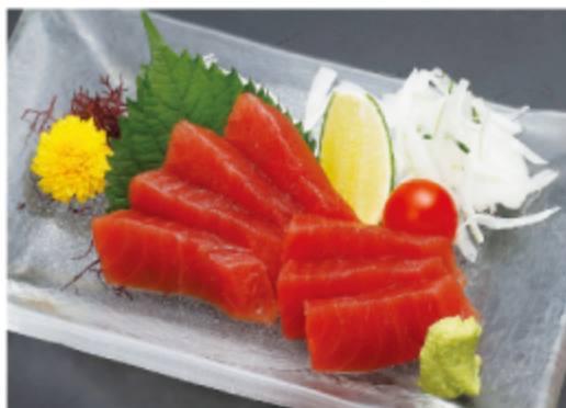
まぐろ 1,000円 (税込 1,100円)