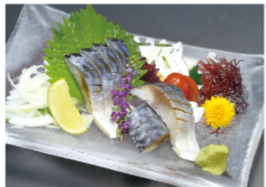
しめ鯖 600円 (税込 660円)

◆本日の活造りは「日替わりメニュー」にて、または「スタッフ」にお問い合わせください。 ※活造りの二次加工（唐揚げ、てんぷら、味噌汁など）は、サービスとなっておりますのでお申し出ください。