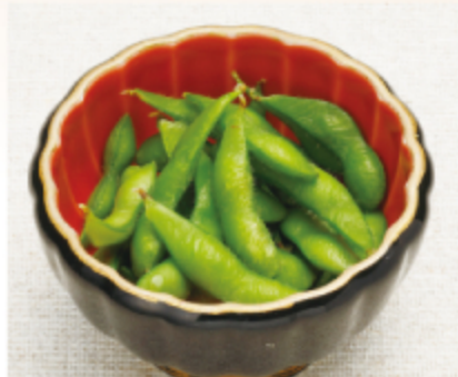
枝豆 350円 (税込 385円)