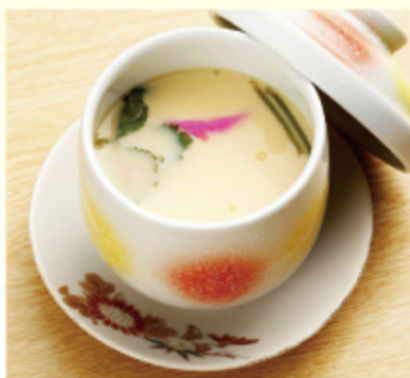
茶碗蒸し 350円 (税込 385円)